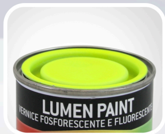
COD. 30020 AMARILLO Caja de 6 Uds.