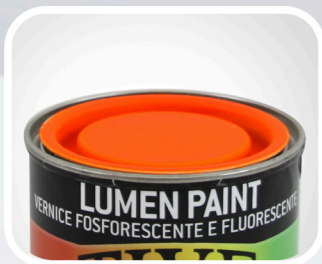
COD. 30021 NARANJA Caja de 6 Uds.