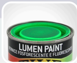
COD. 30023 VERDE Caja de 6 Uds.