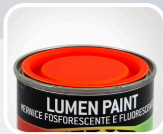
COD. 30022 ROJO Caja de 6 Uds.